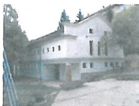
TM EGYMI Szivárvány Általános Iskolája, Szekszárd