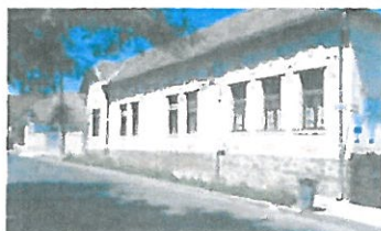
TM EGYMI Székhelyintézménye – Utazó Gyógypedagógus Hálózata, Szekszárd