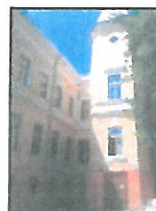
TM EGYMI Móra Ferenc Általános Iskolája - Dombóvár