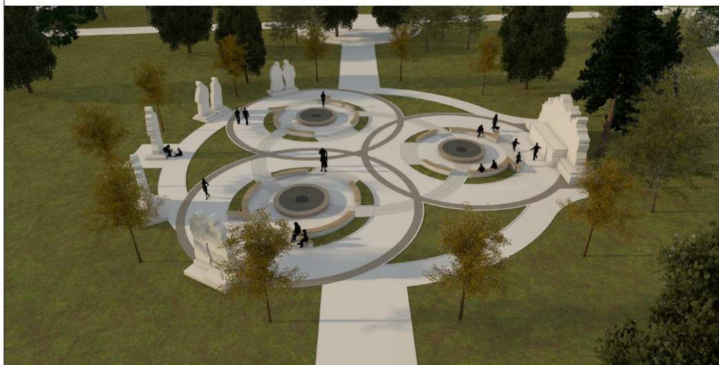
KOSSUTH SZOBORCSOPORT ÚJRAHELYEZÉSI TERVE DOMBÓVÁR, SZIGETERDŐ HR.SZ.:1882/3 É-10 LÁTVÁNY