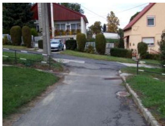
14. sz. kép