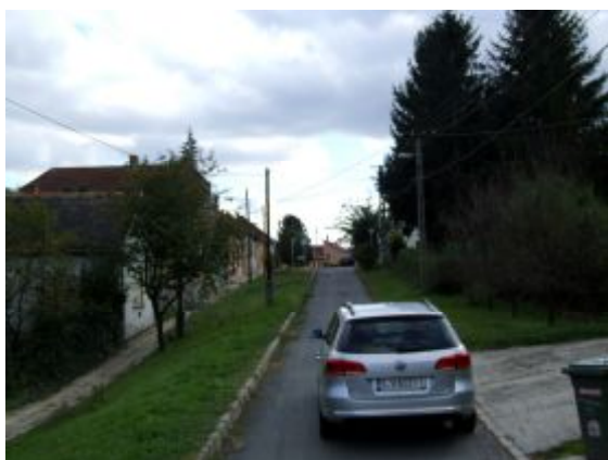
13. sz. kép.

A Bartók Béla utca alsó szakasza kétirányú forgalom lebonyolítására nem alkalmas. Az úttest mintegy 3,5 méter széles és erős lejtésben van. A két szemben érkező jármű kölcsönös lehúzóadásának lehetősége csekély, balesetveszélyt rejt magában (13-14 sz. kép). Nem javaslom a forgalmi rend megváltoztatását.