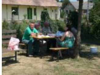
Az előadó megérkezik Szakcsra

- 2011. július 16-án Szakcs településen a Szekszárdi székhelyű Zöldtárs Alapítvány titkára tartott előadást a természetöröknek és a település Polgármesteri Hivatalának dolgozóinak.