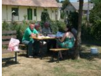
Az előadó megérkezik Szakcsra

- 2011. július 16-án Szakcs településen a Szekszárdi székhelyű Zöldtárs Alapítvány titkára tartott előadást a természetöröknek és a település Polgármesteri Hivatalának dolgozóinak.