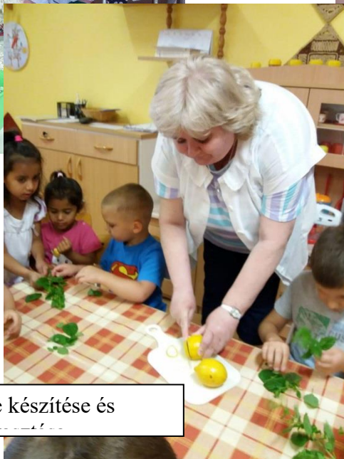
Limonádé készítése és fogyasztása