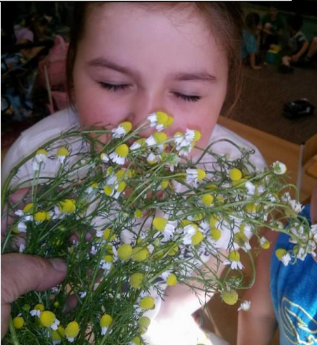
Kamilla feldolgozása, szárítása